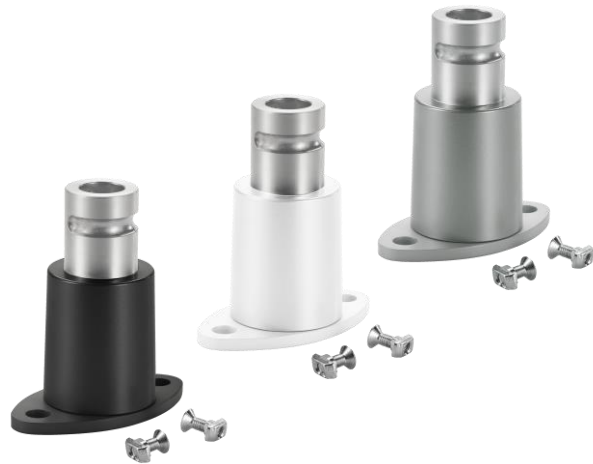
NOVUS Clu Plus Schienenadapter

Ob Zwingen oder Wandhalterung – die NOVUS Clu Plus Monitorhalterungen gibt es mit allen gängigen Befestigungslösungen in Schwarz, Weiß und Silber. Sie können an jeden Arbeitsplatz individuell angepasst werden und halten auf jedem Schreibtisch. Auch ein Customizing für spezielle Möbelsysteme der Industrie ist möglich.