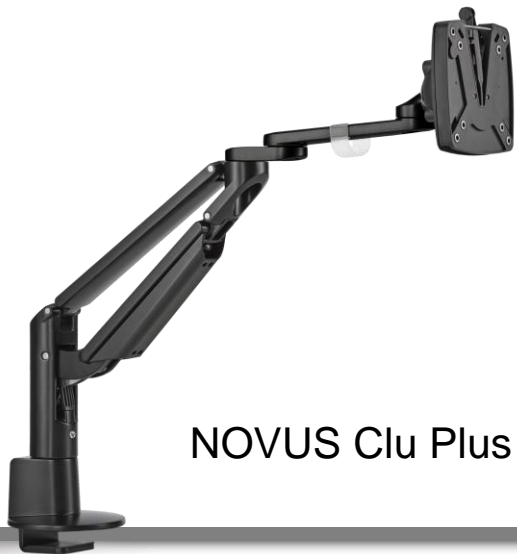
NOVUS Clu Plus

Mit einer Hand einen, zwei oder drei Monitore gleichzeitig bewegen? Die waagerechte Traverse der starken Clu Plus Monitorhalterungen macht es möglich. Egal, wie Sie gerne arbeiten – die Clu Plus Monitorhalterungen sind schnell montiert, sehen gut aus und sorgen für eine optimale Ergonomie.