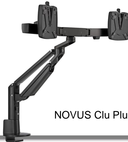
NOVUS Clu Plus X2