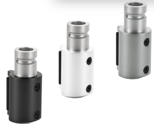
NOVUS Clu Plus Column