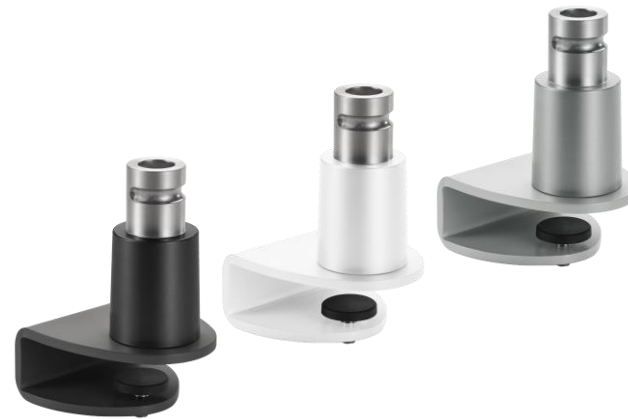
NOVUS Clu Plus Clamp