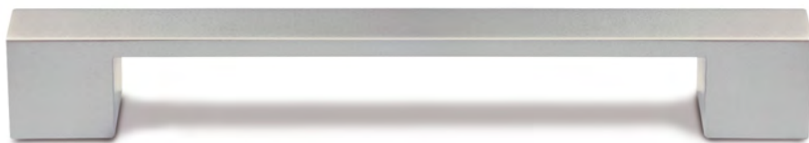
Steggriff | web-handle | bruggreep 1

Raster 160 mm | 160 mm spacing | raster 160 mm