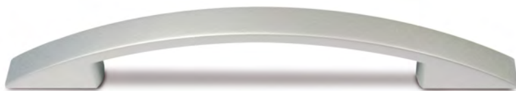
Bogengriff | bow-handle | booggreep

Raster 160 mm | 160 mm spacing | raster 160 mm